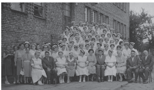
Fot. 4. Dyrekcja, grono pedagogiczne i absolwentki przed nowym budynkiem Szkoły Pielęgniarskiej (1960)

Równoległe z powołaniem szkoły i organizacją dydaktyki, prowadzone były prace nad budową nowej siedziby dla szkoły. W dniu 24 listopada 1949 roku Wojewódzka Rada Narodowa (WRN) w Kielcach podjęła uchwałę o budowie „Szkoły dla Położnych”. Nazwa szkoły pielęgniarskiej była różnie zapisywana w dokumentach, ale jedno jest pewne, działania dotyczyły szkoły kształcącej średni personel medyczny (w okresie tuż po wojnie działały szkoły pielęgniarsko-położnicze).