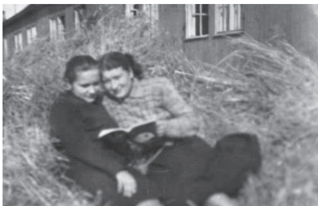
Fot 2 i 3. Uczennice Szkoły Pielęgniarstwa przed barakami internatu (po 1950 roku)