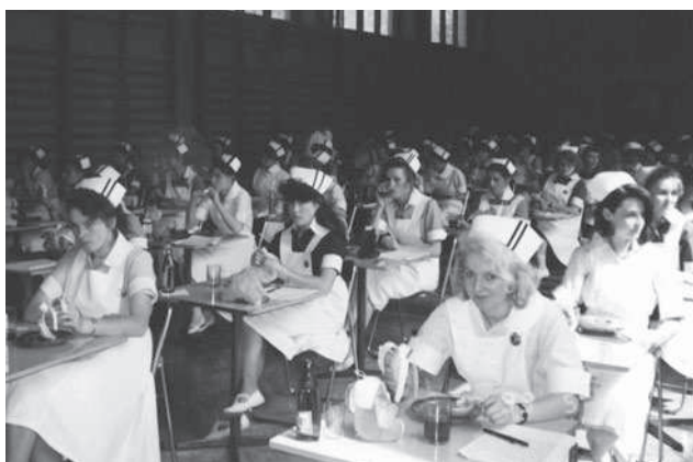
Fot. 5. Uczennice w czasie części pisemnej egzaminu maturalnego w Liceum Medycznym

Kadrę pedagogiczną Liceum Pielęgniarstwa tworzyli nauczyciele przedmiotów ogólnokształcących, zawodowych i nauczyciele zawodu – pielęgniarki o pełnych kwalifikacjach. W pierwszych latach istnienia Szkoły występowały trudności z pozyskaniem do pracy pielęgniarek z pełnymi kwalifikacjami. Za zgodą Ministra Zdrowia zatrudniano wyróżniające się absolwentki, które uzupełniały w późniejszym czasie wykształcenie pedagogiczne. Nauczycielki zawodu kierowane były na kurs pedagogiczny, a następnie