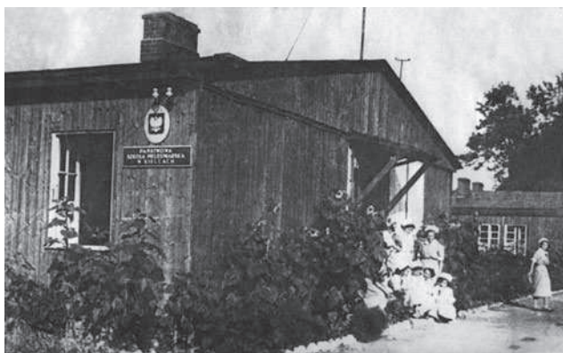
Fot. 1. Pierwsza siedziba Państwowej Szkoły Pielęgniarstwa w Kielcach